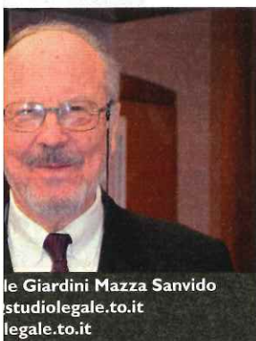
le Giardini Mazza Sanvido studiolegale.to.it legale.to.it

questa in cui flessibilità e versatilità sono indispensabili». L'attività formativa consiste nel far realizzare ai partecipanti una vera e propria opera d'arte, sotto la guida di un artista contemporaneo. «Un'opera d'arte può essere considerata un progetto a tutti gli effetti», continua Piero Tucci, «per la cui realizzazione occorre far riferimento a tutte quelle competenze e abilità di cui un professionista deve dar prova nella propria vita lavorativa».