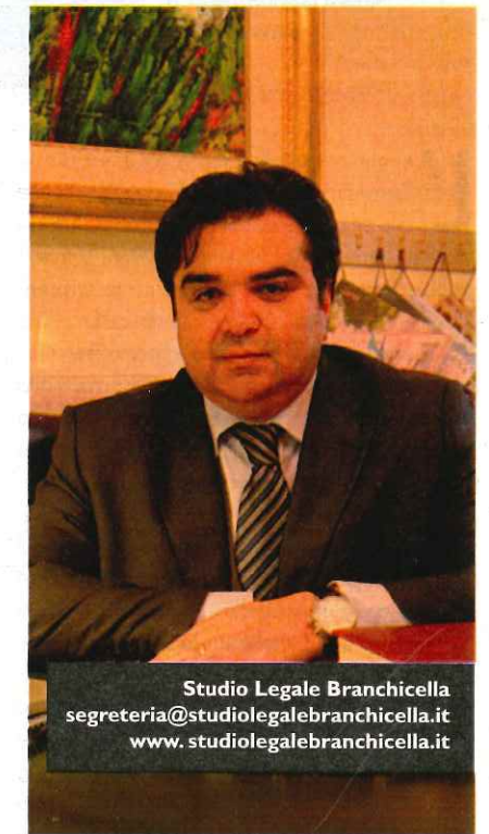
Studio Legale Branchicella segreteria@studiolegalebranchicella.it www.studiolegalebranchicella.it

zazioni aziendali, operazioni interne alle società, questioni inerenti al capitale azionario». Lo studio legale Branchicella svolge inoltre attività di consulenza e assistenza sia giudiziale che stragiudiziale in materia di recupero crediti nell'interesse di società commerciali su tutto il territorio nazionale, nella costituzione di nuove società e nella redazione degli statuti, in materia di contenzioso tra società, tra soci e società in materia di operazioni di rilievo e cessione, fusione, divisione e liquidazione di società, e ha maturato anche una vasta esperienza in ambito del diritto del lavoro (assistenza nelle vertenze, lavoro subordinato, pubblico impiego, lavoro autonomo, previdenza sociale).